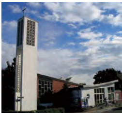
Friedenskirche Gangelt, Lohausstraße 36

Die Veranstaltungen finden in den zwei Gemeindezentren der Evangelischen Kirchengemeinde Gangelt, Selfkant, Waldfeucht statt: