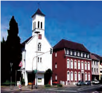
Gemeindezentrum Geilenkirchen, Konrad-Adenauer-Straße 83, Geilenkirchen

Die Veranstaltungen finden in den zwei Gemeindezentren der Evangelischen Kirchengemeinde Geilenkirchen statt: