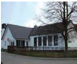
Geusenhaus Bocket, An der Flachsroth 4 Waldfeucht