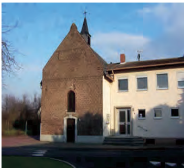
Gemeindehaus in Teveren, Welschendriesch 9, Geilenkirchen-Teveren