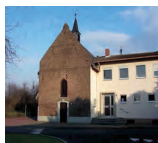
Gemeindehaus in Teveren, Welschendriesch 3