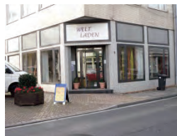
Weltladen Gangelt Sittarder Str. 5, Gangelt