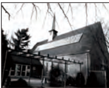
Gemeindezentrum Christuskirche Frelenberg Theodor-Seipp-Str. 5