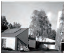
Gemeindezentrum „Hütte“ Marienberg Schulstr. 46