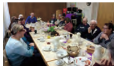
Café Auszeit in Gangelt

Leben wie „Gott in Frankreich“ kann man auch in Bocket im Geusen-Haus und im Gemeindezentrum Friedenskirche Gangelt.