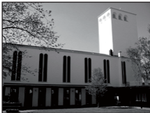
Gemeindezentrum Erlöserkirche Übach Maastrichter Str. 49

Die Veranstaltungen finden in den drei Gemeindezentren der Evangelischen Kirchengemeinde Übach-Palenberg statt: