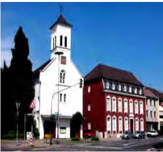
Gemeindezentrum Geilenkirchen, Konrad-Adenauer-Straße 83, Geilenkirchen

Die Veranstaltungen finden in den zwei Gemeindezentren der Evangelischen Kirchengemeinde Geilenkirchen statt: