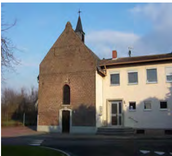
Gemeindehaus in Teveren, Welschendriesch 9, Geilenkirchen-Teveren