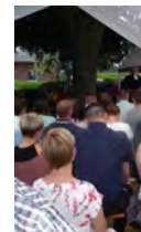
Fest 2018