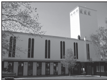
Gemeindezentrum Erlöserkirche Übach Maastrichter Str. 49

Die Veranstaltungen finden in den drei Gemeindezentren der Evangelischen Kirchengemeinde Übach-Palenberg statt: