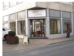
Weltladen Gangelt Sittarder Str. 5, Gangelt