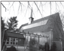
Gemeindezentrum Christuskirche Frelenberg Theodor-Seipp-Str. 5