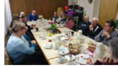
Café Auszeit in Gangelt

Leben wie „Gott in Frankreich“ kann man auch in Bocket im Geusen-Haus und im Gemeindezentrum Friedenskirche Gangelt.