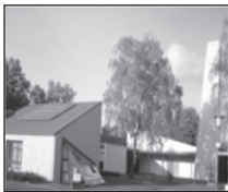
Gemeindezentrum „Hütte“ Marienberg Schulstr. 46