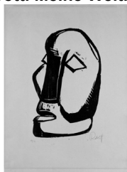
Karl Schmidt-Rottluff Moses, 1919

Die Religion war für viele Künstler zu Beginn des 20. Jahrhunderts ein Thema von besonderer Bedeutung. Insbesondere Emil Nolde, Karl Schmidt-Rottluff und Max Beckmann schufen in der Zeit um den Ersten Weltkrieg eine Vielzahl herausragender Werke religiösen Inhalts. Bei der Darstellung von Motiven des Alten und Neuen Testaments, vor allem in Holzschnitten und Radierungen gelang es ihnen in einmaliger Weise, den psychologischen Gehalt der Szenen herauszuarbeiten. Die Ausstellung präsentiert rund 70 druckgrafische Blätter des Expressionismus gemeinsam mit thematisch verwandten Aquarellen und Zeichnungen. Die Werke aus einer Schweizer Privatsammlung werden erstmals in der Öffentlichkeit präsentiert.