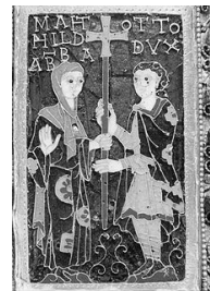
Mathilde mit ihrem Bruder Otto auf der Stifterplatte des Otto-Mathilden-Kreuzes

Interessant sind gerade die Sichtweisen der unterschiedlichen Epochen. Hier frühes Mittelalter – „Hoch“-zeit der Religion verbunden mit einer ganz gewissen Sichtweise auf das Christensein, dort eine Kunst, die sich radikal auseinandersetzt mit den Schrecken der Wirklichkeit und nach neuen Ausdrucksmöglichkeiten sucht.