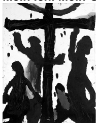
Louis Soutter, 1939 The empty cross