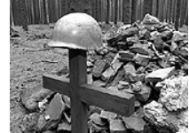
Auf dem Pfad des Gedenkens

Heute gehört der Hürtgenwald, Vossenack und die ‚Perle der Eifel‘ - Simonskall zu den schönen Touristenzielen der Eifel. Unter weitem Himmel erstrecken sich im Wechsel von Höhen und Tälern malerisch Wiesen und weite Wälder. Wälder, die erst nach 1945 wieder aufgeforstet wurden, denn hier fanden zum Schluss des 2. Weltkrieges schreckliche Kämpfe zwischen den Alliierten und Deutschen statt.