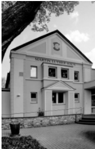
Martin-Luther-Haus, Moltkestraße 3

Die Veranstaltungen finden in folgenden Gebäuden der Evangelischen Kirchengemeinde Eschweiler statt: