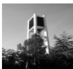
Friedenskirche, Friedrichstraße 29, Eschweiler

donnerstags ab 12. Januar 2012 außer Schulferien