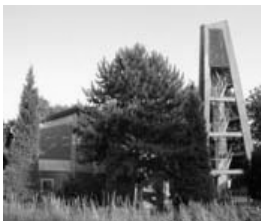
Evangelisches Gemeindezentrum Langerwehe, Josef-Schwarz-Straße 21