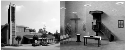
Evangelisches Gemeindezentrum Inden/Altdorf, Auf dem Driesch 1–3

Die Veranstaltungen finden in den zwei Gemeindezentren der Evangelischen Kirchengemeinde Inden-Langerwehe statt: