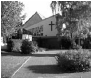
Evangelisches Gemeindezentrum Dürwiß Konrad-Adenauer-Straße 35, Dürwiß