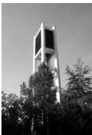
Friedenskirche, Friedrichstraße 29