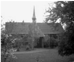
Evangelisches Gemeindezentrum Weisweiler, Burgweg 7, Weisweiler

Die Veranstaltungen finden in den zwei Gemeindezentren der Evangelischen Kirchengemeinde Weisweiler – Dürwiß statt: