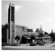
Evangelisches Gemeindezentrum Inden/Altdorf