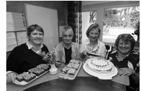
Vom Kuchen ...

Anmeldung: Ev. Erwachsenenbildung im Kirchenkreis Jülich, Tel. 02461 9966-0 bzw. eeb@kkjrjuelich.de