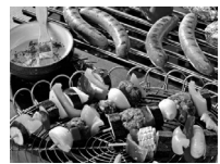
bis zum Würstchen

Erwerben Sie die Bescheinigung, mit „losen“ Lebensmittel in Gruppen und bei Gemeindefesten umgehen zu dürfen